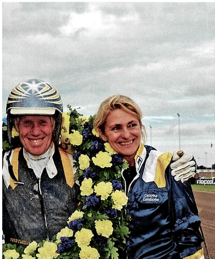
svenskt rekord med Standout på tiden 1.10,9a.