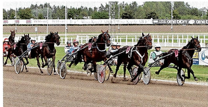
Quid Pro Quo utvändigt om ledande Global Offshore.

(Ulf Ohlsson strödde beröm över Quid Pro Quo och dennes insats utvändigt ledande Global Offshore)