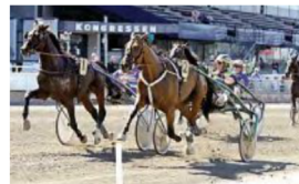
• Song And Dance Man.

Adielsson åkte in och bytte häst i Stig H:s stall, men inte taktik. Devs Darling (e. Infinitif) ser inte speciellt startsnabb ut, men från springspår med Erik Adielsson bar det iväg snabbt till ledningen. Hästen fick några tryckare på vägen, men klev undan till slut i förbättrad stil.